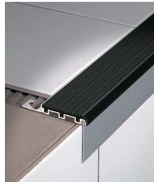
stairtec FSL-A51 + FSA 50 AS

Topo terminal (esquerdo ou direito), SKU: FSLT-P**/D o FSLT-P**/S. Exemplo Código: FSLT100P23/D o FSLT100P23/S