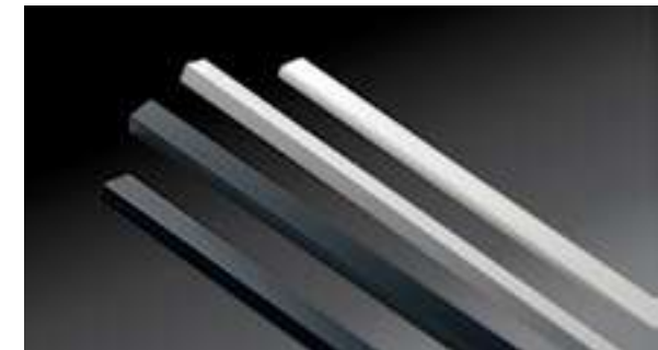
Branco e Preto