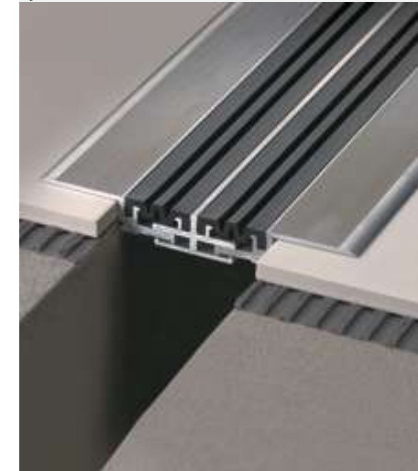
jointec GDM 860 AN51