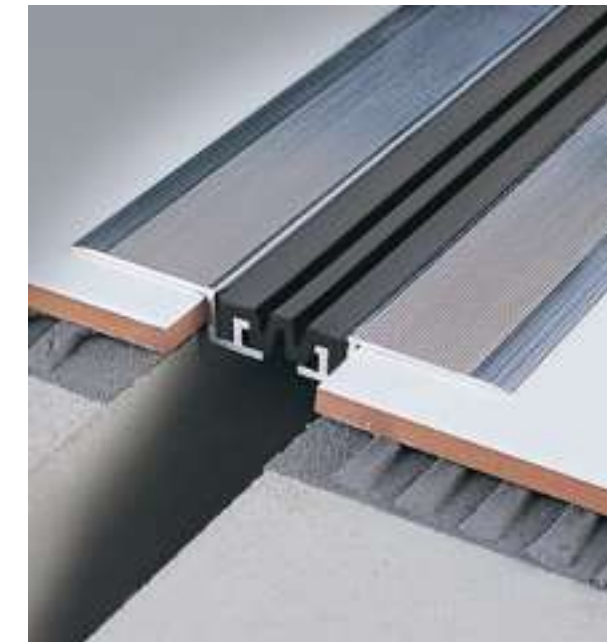
jointec GD 400 A51

As juntas são enviadas não montadas com inserto standard: GI370 ou GI470 conforme pedido. Para pedir o inserto com superfície lisa juntar a letra S após o código do artigo. Ex. GE500AN51S.